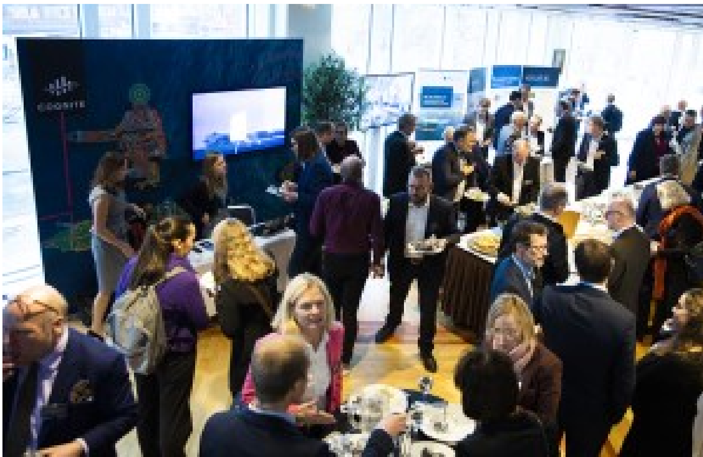
18 leverandører stilte ut sin høyteknologi under årets OG21-forum.

Den nye OG21-rapporten er tydelig på at vi trenger sterke incentiver både for forskning, for pilotering og for tidlig bruk. OG21 anbefaler derfor i rapporten: